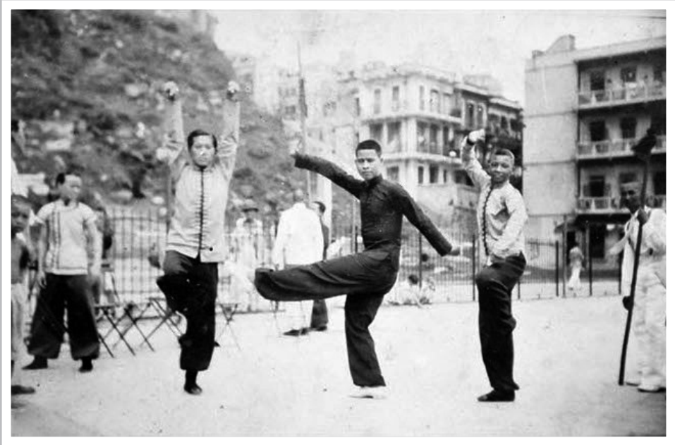
上環普慶坊香港精武體育會會員練習武術。