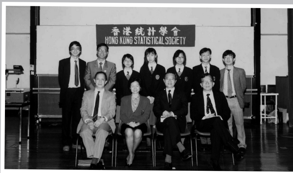
1989年香港統計學會舉辦的香港統計習作比賽，亦是學科與活動相結合的例子，圖為獲獎隊伍。