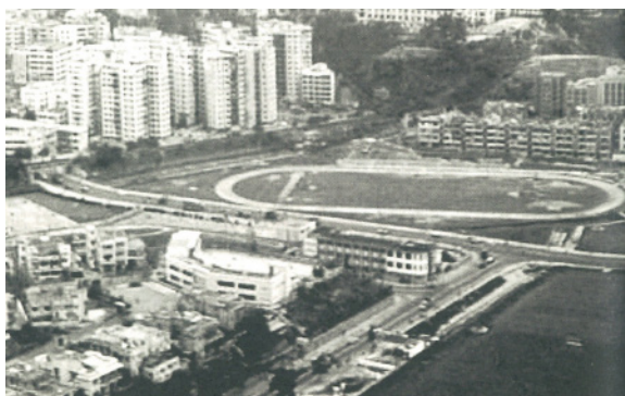
昔日在香港仔運動場舉行賽事。