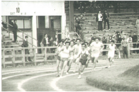
運動員在加路連山南華體育會田徑場比賽。

Colonists do is to get a racecourse, polo ground and cricket ground...」(《南華早報》1908年7月13日)。由此可見英國人對體育的重視，西方人推崇體育活動亦藉其優勢在當時的私人會所植根及發展。