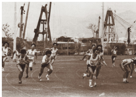
1979 年落成的灣仔運動場。