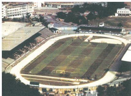
1955年，政府大球場落成，採用煤灰沙地跑道，跑道環繞足球場而建，一周為450米，較標準長50米（圖左）。80年初香港大球場的樣貌（圖右）。

址：PO Box 280，方便收取會員訊息及各項賽事報名表等，作為當時重要聯絡橋樑。