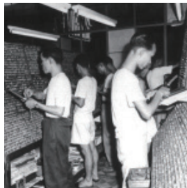
排字工人於人字形字架前 按稿件檢排鉛字

當時史立德當學徒的印刷廠，主要印刷單張及各家公司或商行開列發票時使用的單據簿。後來技術先進了，印刷廠會使用較大部的柯式印刷機。當時香港工業開始起飛，很