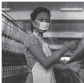
1950 年代 工作中的紡織廠工人

當時印刷行業屬體力勞動型工作，原因是紙張笨重，而且需要經常搬運。當學徒的其實都是「打雜」，什麼都要幹，