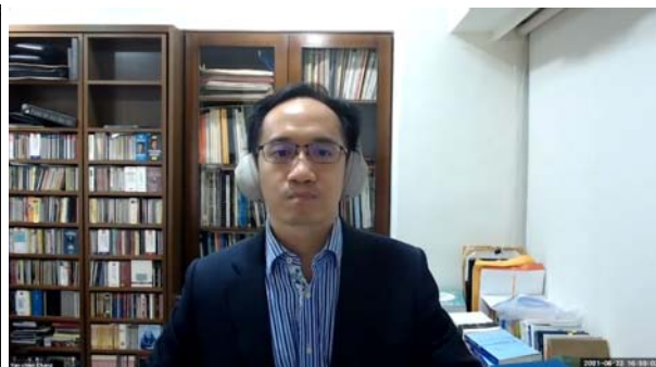
張永健教授進行演講

在下午的部份， 張永健教授 （中央研究院法律學研究所法實證研究資料中心主任及研究員）進行題為「大數據、人工智能和法實證研究」的講座。會議期間，他討論與使用大數據和應用人工智能相關的法實證研究的新發展。許多與會者在演講中提出問題，並與講者進行熱烈的討論。通過張教授的詳細講解，與會者對大數據和人工智能在實證研究中的潛在用途有了更深入的了解。