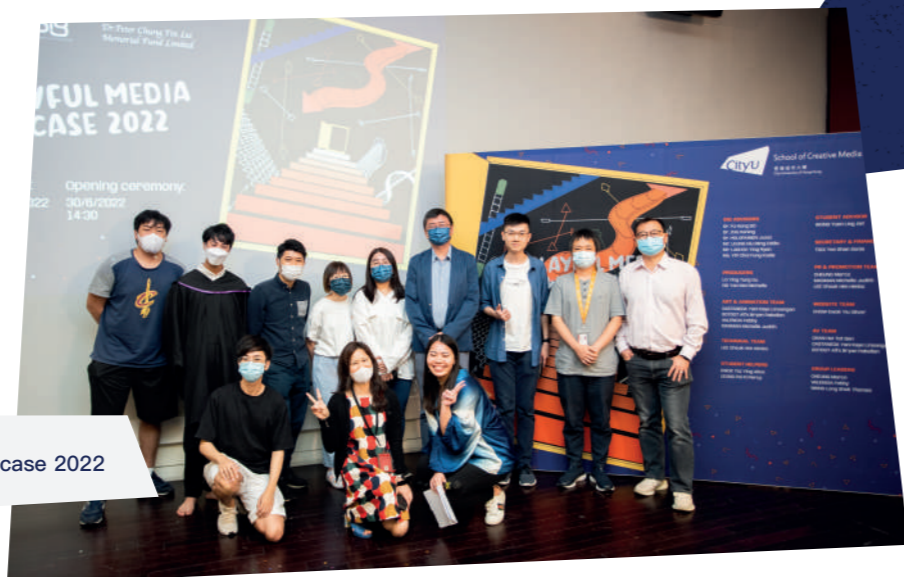
特別興趣小組 Playful Media Showcase 2022