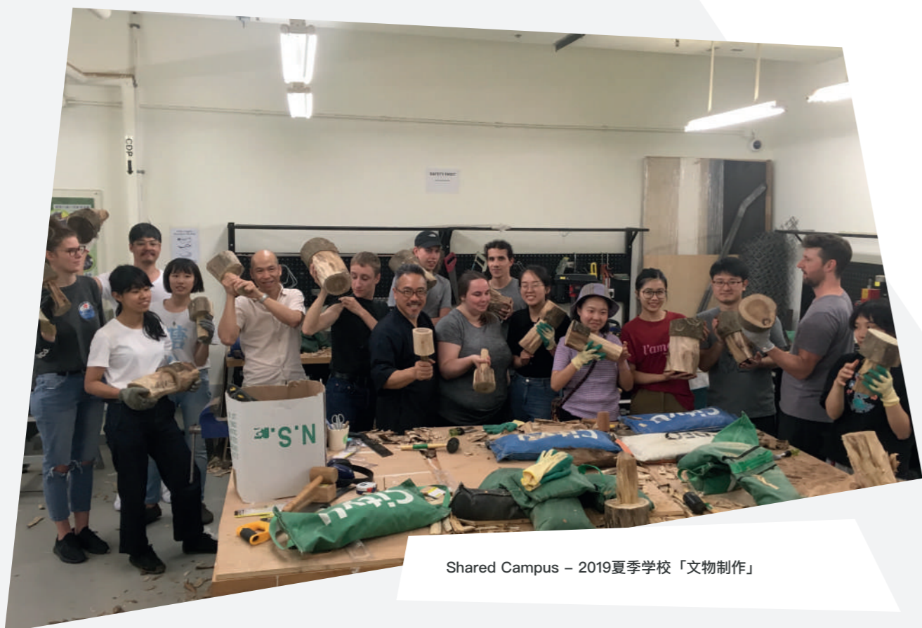
Shared Campus – 2019夏季学校「文物制作」

电邮: SMGO@CITYU.EDU.HK 查询: (852) 3442 8049 传真: (852) 3442 0408 www.scm.cityu.edu.hk