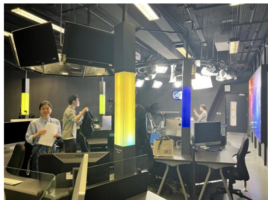
香港城市大学媒体与传播系