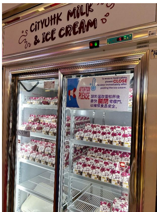
广受好评的“城大牛奶”

在离学校图书馆不远的一个角落，有城大人力荐的“城大牛奶”售卖，因为不只一位城大的老师同学问我有没有试过这个牛奶。这是城市大学自有牧场生产的鲜奶，结合了兽医专业的课程教学，获得过不少创新奖项。虽然没有喝出特别的味道，但我真的喝过了，以后有机会还要尝尝这个牛奶做的雪糕。