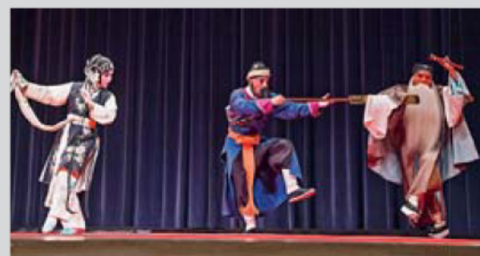
■ 表演者一舉手一投足，呈現崑腔細膩婉轉的特色。

此次演出的演員更有多位是國家一級演員，在竹笛、小鼓、木梆子、鑼和鈸等現場伴奏下，全情投入演出，一舉手一投足，呈現崑腔細膩婉轉的特色。經典的折子戲充分展示崑劇的唱、念、做、打以及舞蹈、武術及文學的表演藝術元素，令人再三回味。