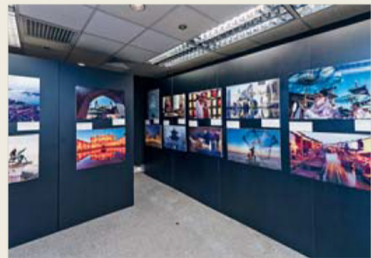
■ 「踏上馬哥孛羅的足印」攝影展，為參觀者提供一趟沉浸式馬哥孛羅之旅的體驗。

為期20天，由意大利安莎通訊社籌辦的「踏上馬哥孛羅的足印」攝影展已於4月14日圓滿結束。攝影展中共展示40幅攝影作品，讓觀眾沉浸在馬哥孛羅的旅程，感受其非凡的體驗。