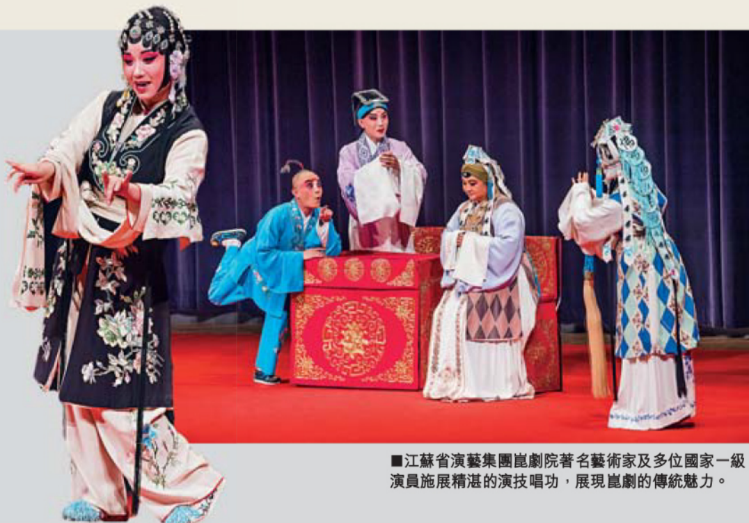
■ 江蘇省演藝集團崑劇院著名藝術家及多位國家一級演員施展精湛的演技唱功，展現崑劇的傳統魅力。