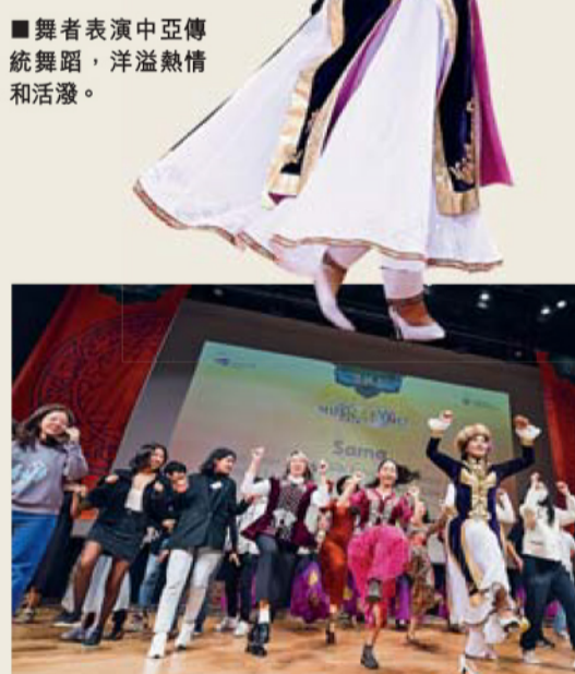
■ 舞者表演中亞傳統舞蹈，洋溢熱情和活潑。