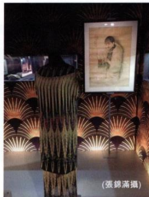
吸收了中國竹與扇子的Art Deco設計，還應用在旗袍上。