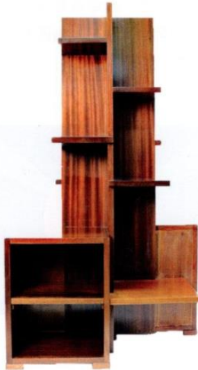
以幾何方格設計的Pylon書架。