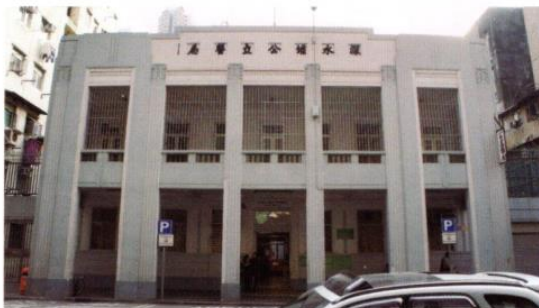
深水埔公立醫局亦見整齊的幾何格局。