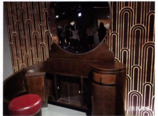
硬直線條，配上圓形，設計出令人窩心的化妝檯。

顯出時代新氣派。正值1925年巴黎大皇宮舉行裝飾工藝博覽會，法國工藝展品可大規模亮相。