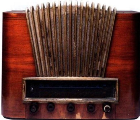
收音機的造型用上了中國的插竹效果。