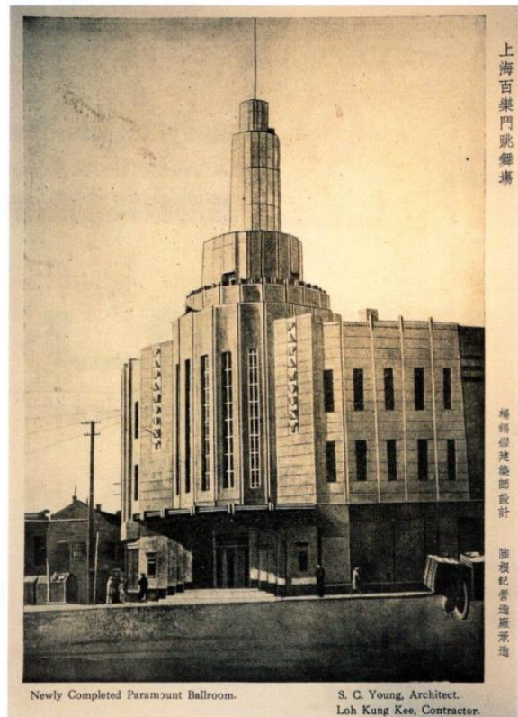
Art Deco建築，上海百樂門跳舞場建築外貌工整。

但凡設計，皆講求新穎突破，可是卻有一種流派百年不變，成為永恆經典，那是興起於巴黎上世紀20年代的Art Deco(裝飾藝術)設計。以優雅幾何為基礎，主要利用冷酷的幼、硬、直線條，一改此前俗豔鋪張花卉樣式的Art Nouveau(新藝術運動)。