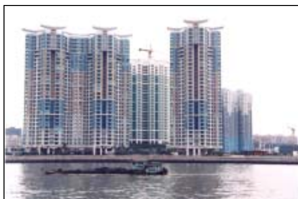
圖片 16. 珠江南岸之私人屋苑式樓房

在過去的二十年，廣州為解決民居所需而提供的住房或樓宇大致可分為四類形。一是由戰前樓宇翻新後的住房；二是單位提供的福利房；三是提供給經審查後符合特定經濟條件的住房困難戶；四是近年大為流行的商品房。其他還有一些利用公積金認購的廉價房，或由政府提供土地並由單位或團體集資而建的樓房。