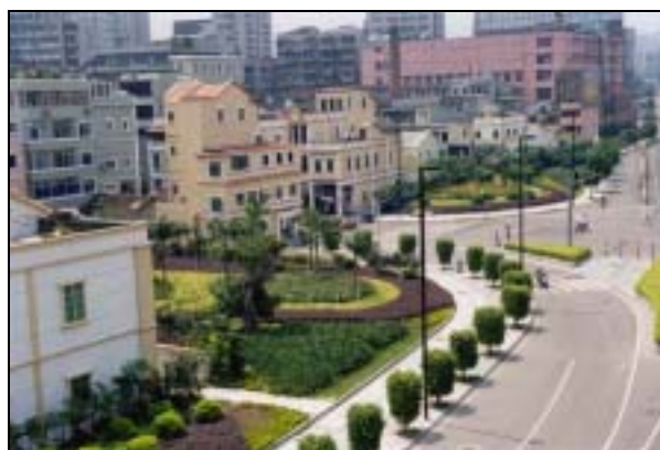
圖片 10. 內環路民居旁之綠化地段

經過了近五年的經營，廣州市內的綠化成績斐然。一些重要的大型綠化項目，如內環高速公路網絡、地鐵沿線各站廣場及火車東站廣場之綠化工作；珠江新城、珠江南北堤岸、國際會議中心之臨江公園、臨江大道及廣州大道之綠化帶；及其他很多市內道路的擴闊和綠化改造，以及小區內的綠化建設等，均是近年的成功例案，實質地改善了廣州的城內涵，大大提昇了人民的生活素質。