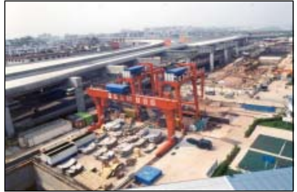
圖片 6. 興建中之地鐵二線三元里站

b. 在軌道交通建設方面，廣州地鐵一號線及二號線第一期分別於1999年中及2002年底先後通車。此兩線地下鐵路分別以東西及南北走向為主軸貫通大部份主城區，為市內各重點公共設施，如廣州火車站和東站、國際會議中心及其他主要人口或商業區等提供了方面快捷的交通接駁，亦為日後各新舊區的改善和發展奠下了重要的基礎。至於全長36公里的三號線的設計及招標工作亦已完成；此線主要為南北走向，北起廣州東站，途經廣州新城市中軸線，向南直達番禺區，全線將會在2005年底建成。近期亦因應南沙的開發，三號線第一期亦會伸延至番禺的南沙港。