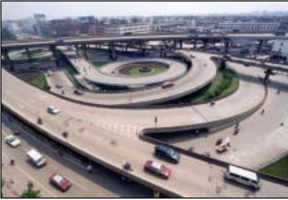
圖片 4. 北環路白雲機場交匯口