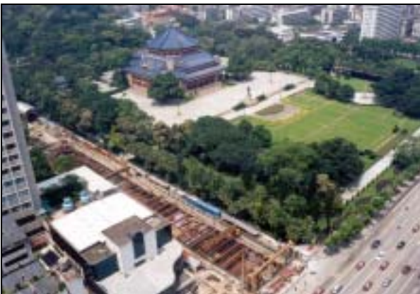
圖片 5. 興建中之地鐵二線越秀區途經中山紀念堂段

c. 環保建設方面 – 在90年代初廣州的工業仍有超過55%集中在主城區內，造成工業廢氣、廢渣、廢水、煙塵及噪音等問題嚴重。在新的整治規劃中，污染工業採用改造和易地的方式，透過合理的城市建設和佈局，並利用新的開發區如黃埔、珠江後航地段或南沙開發區的土地，以降低工業區的密度，使污染問題可以整治和解決。除此之外，一系列市內污水收集渠道及大型城市污水處理廠自2001年陸續建成，其中包括了獵德、西朗及大坦沙等大型污水處理設施，令城市污水處理量達總排放率的60%。其他市內河道的淨化工作亦大致得到整治和解決。