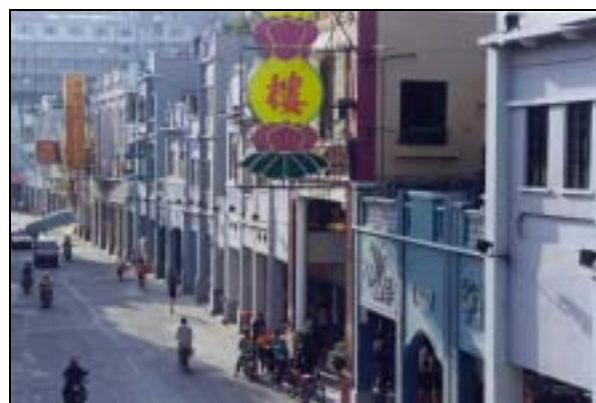
圖片 13. 經過翻新的荔灣上下九甫街

隨著80年代的開放與經濟發展，一批以功能為主的店鋪在一些傳統街道首先興旺起來，取其成行成市的集中性，方便了多類行業的物流與銷售。這類街道的例子有東山區沿江東路一帶專售電工與電子產品的街道，越秀區解放路與起義路一帶集中了時裝衣履批發的街道，泰康路裝飾用品市場，德政路/文德路文化用品專賣街，或在荔灣區清平路及梯雲路一帶之中藥、水產及副食品批發街道。