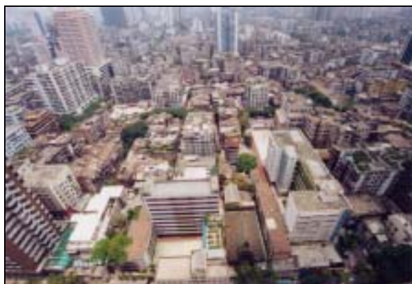
圖片 12. 舊城區內新舊樓宇的混雜情況

二十世紀初的城市格局現今已不能滿足現代城市的需要，例如空間狹小、佈局不均、街道迂迴狹窄、設施嚴重不足，及樓房老化失修等問題長期存在。近二十年廣州市政府雖然大力加強市內整體基建，改善全市環境，但舊區如何有效在同步建設中融入現代化的廣州市裏，實際上在設計與執行時仍存有一定的困難和局限。