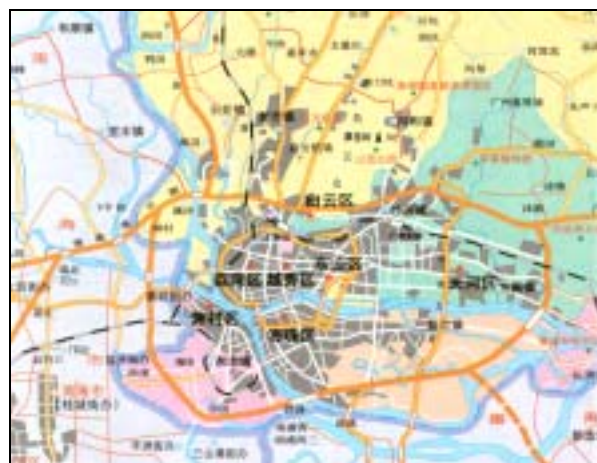
圖片 1. 廣州市城區範圍

廣州市的結構性發展規劃，最早是依據國務院在1985年提出的要求，和參照國家計委1987年頒發的『國土規劃編制辦法』為基礎，而作出初步建構，並在1989年成立廣州市國土規劃辦公室，正式負責組織編制廣州國土規劃工作。