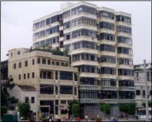
圖片 17. 同一座位於荔灣區樓宇在清拆違章物前後的外貌

近年高級的商品樓房隨著市民的消費力提高而漸形成一個市場。這類樓宇很多時在設計、設施及管理的素質上均大為改善，這在建構一份優質的居住文化上起著一定的引導作用。而同一時間，政府亦透過行政或其他經濟手段，如提供優惠或補貼等措施；再加上整體社會經濟的持續改善，市民對置業的動機大大增強，在需求與供應的互為推動下，新一代質素較高的商品樓房亦漸趨普及，這肯定會為廣州的居住情況帶來正面實質的改善。