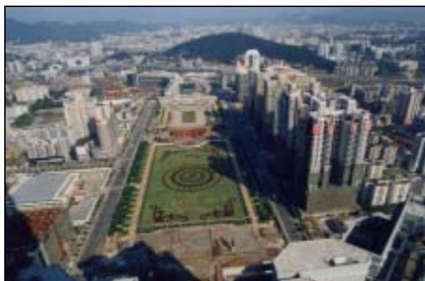
圖片 3. 廣州新城市軸線的北起點 – 廣州東站

向一帶的區域為中心。80年代以來，廣州經歷了高速發展期，因而對土地的供應產生強大的需求。廣州西面的土地因受珠江與白沙河的障礙而不便於交通和開發，城市的擴展因而傾向續漸東移。