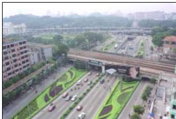
圖片 9. 市內主幹道之綠化帶（解放北路）

經過了近五年的經營，廣州市內的綠化成績斐然。一些重要的大型綠化項目，如內環高速公路網絡、地鐵沿線各站廣場及火車東站廣場之綠化工作；珠江新城、珠江南北堤岸、國際會議中心之臨江公園、臨江大道及廣州大道之綠化帶；及其他很多市內道路的擴闊和綠化改造，以及小區內的綠化建設等，均是近年的成功例案，實質地改善了廣州的城內涵，大大提昇了人民的生活素質。