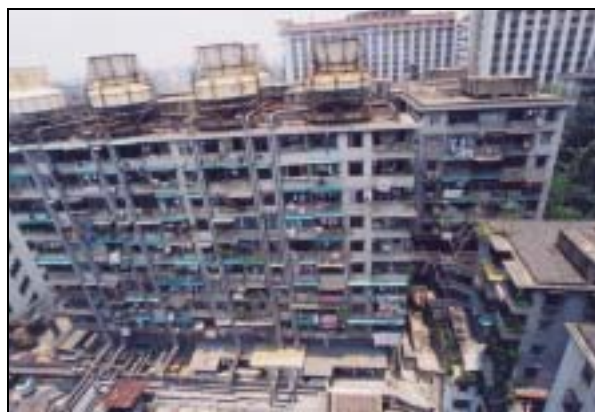
圖片 15. 位於越秀北的國企單位員工住樓

在60年代初期，廣州市內人口不足245萬，大部份主要集中於荔灣，越秀及東山等較舊的區內，大都居於傳統的平房或低層的戰前樓宇。在整個60至70年代中後期，廣州市內的非農戶人口增加了不足40萬，在當時的年代民居建設基本上是停滯不前的。70年代後期改革開放，城區人口亦由1978年的280萬急增至1998年的399萬。不同類型的樓宇因而需求大增，以滿足人口的增長及生活質素隨著經濟的改善而提昇。