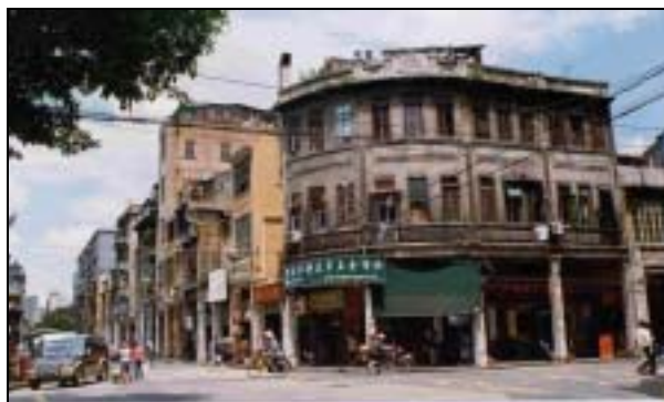
圖片 11. 越秀區內的舊街道

帶，全區面積約有55平方千米。其中尤以荔灣一帶的西關區，因較遠離市中軸範圍，開發較慢，因而保存得較為完整，仍可隱見其二十世紀二、三十年代的原貌。