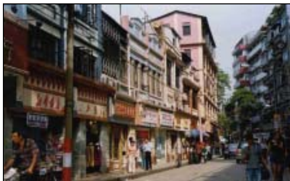
圖片 14. 東山區暑前路一帶的商業街

色的樓房。現時的北京路亦正作出類似的全面翻新，路面並辟為永久限制車輛行駛的步行街道，形成一個更具焦點效應，結合了商業與旅遊的一條重點主題街道。