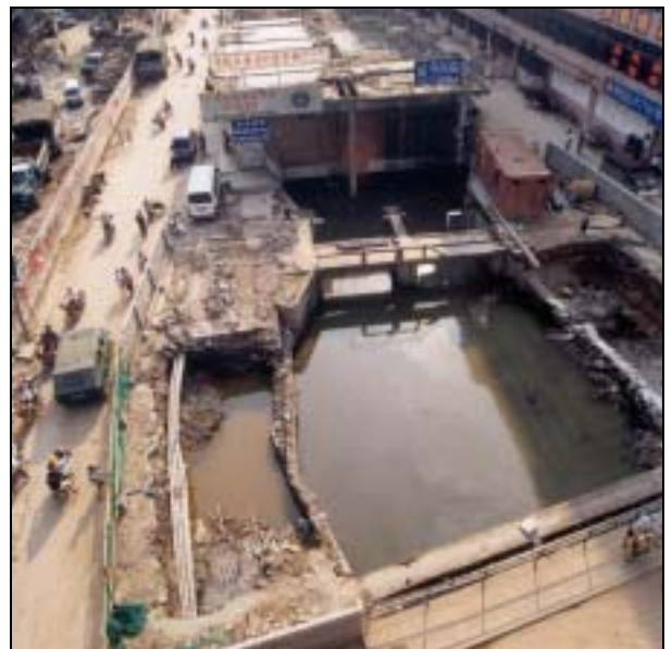
圖片 7. 市內排污暗渠的修建