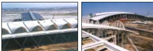
圖片 8. 興建中位於花都市的新廣州國際機場

其實，廣州近年的城建項目極多元化和繁多，其中還有很多與改善市容、城市形象、綠化及加設重點商業或旅遊景點設施的各種相關項目，不易一一羅列。