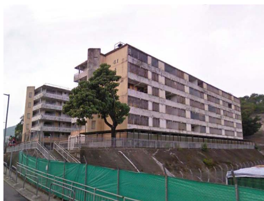
美荷樓(香港最早期的公共房屋)： 活化為青年旅舍

行政長官在《2007 - 08 施政報告》中，為全面開展文物保育工作公布了一系列的文物保育措施，當中包括嶄新的《活化歷史建築伙伴計劃》(《計劃》)，把政府擁有但正閒置的歷史建築，透過社會企業形式活化再用，使其成為獨一無二的文化地標。這項計劃具有雙重目標：既要保存歷史建築，又要善加利用，以符合社會最大利益，並希望藉此推動市民積極參與歷史建築的保存。由於這些文物建築大多位於較舊的地區，計劃所引進的新經濟活動，可以為舊區注入動力和新鮮感，產生催化更新的作用，為當區帶來裨益。自 2008 年初起，《計劃》分兩期推出共 12 幢歷史建築，反應非常熱烈，共收到超過 150 份申請書，經詳細評估，政府最終為 9 幢建築選出合適的保育及活化方案。