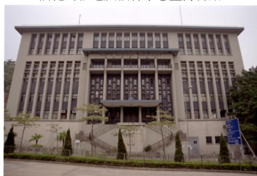
北九龍裁判法院(60 年代的典型公共建築)：活化為藝術設計學院