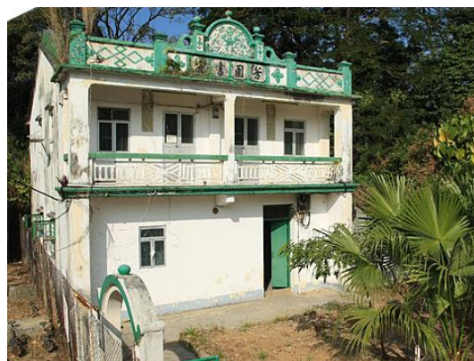
芳園書室(馬灣唯一尚存的戰前小學)： 活化為旅遊及教育中心暨博物館