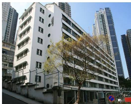
荷李活道已婚警察宿舍： 活化作創意產業用途

基於歷史和建築價值的考慮，以及公眾保育文物的意願，政府計劃保留並活化該址作創意產業用途，提供包括展覽館、創作室、藝術教育和培訓中心、海外到訪藝術家旅舍等用途，亦會包括一個中央書院遺址展覽中心及遺跡展示區。