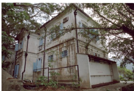
舊大澳警署(20 世紀初典型紀律部隊及殖民風格的建築)：活化為文物酒店