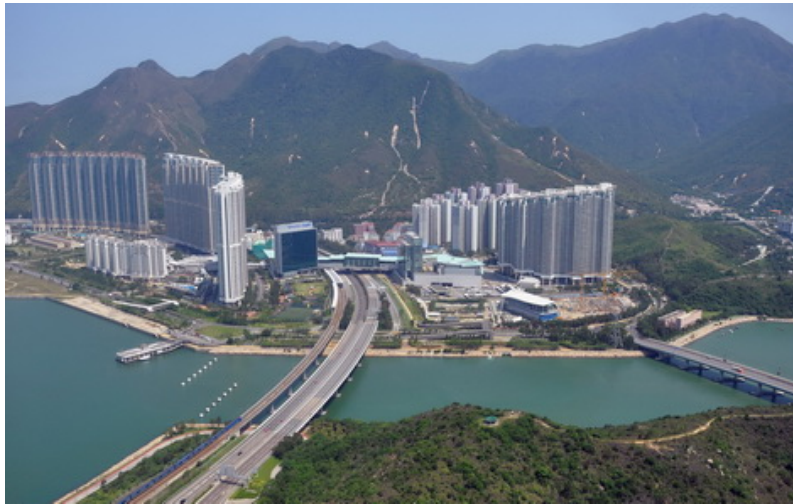
將軍澳及東湧新市鎮的建設